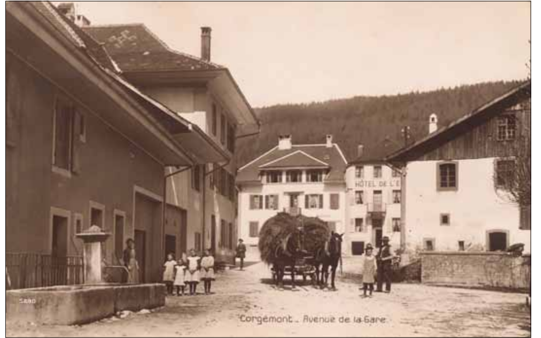
Une vue du village à l'époque, puisée croquée à l'« Avenue de la Gare » en 1916.