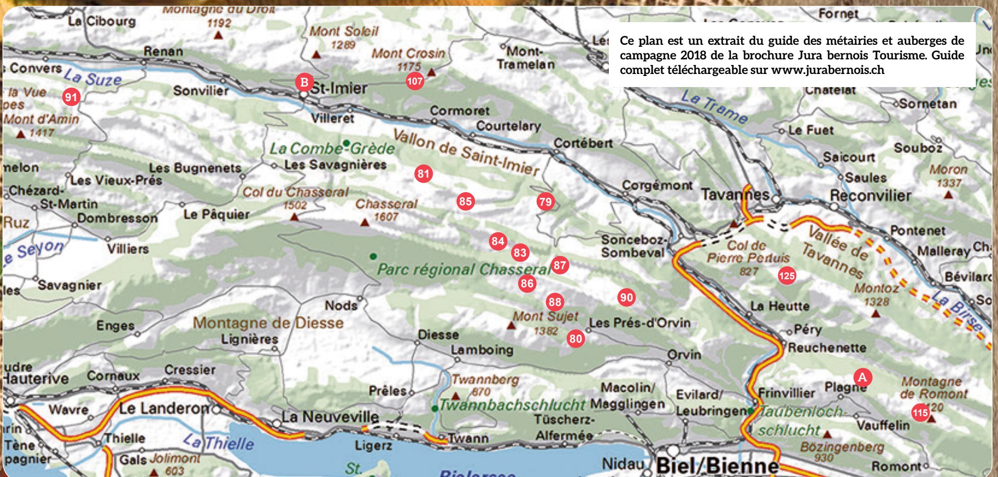
Ce plan est un extrait du guide des métairies et auberges de campagne 2018 de la brochure Jura bernois Tourisme. Guide complet téléchargeable sur www.jurabernois.ch