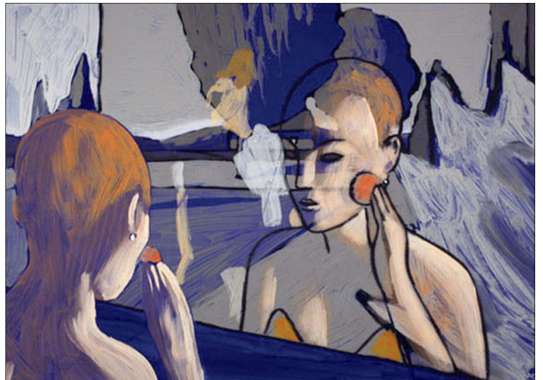
Une image de « Romance », son dernier film, terminé en 2011.

Georges Schwizgebel sera à l'honneur au Royal