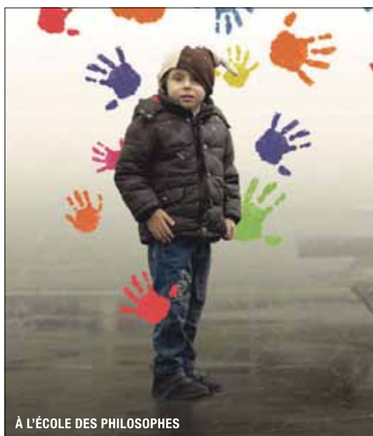
À L'ÉCOLE DES PHILOSOPHES

de Fernand Melgar. Cinq petites filles et petits garçons font leurs premiers pas dans une école spécialisée de Suisse romande. Ils sont tous atteints d'un handicap mental plus ou moins profond. Accompagnés d'une équipe de pédagogues et de thérapeutes persévérants, ils vont devoir apprendre à vivre ensemble. En français. 6 ans (sugg. 14). Durée 1h37.