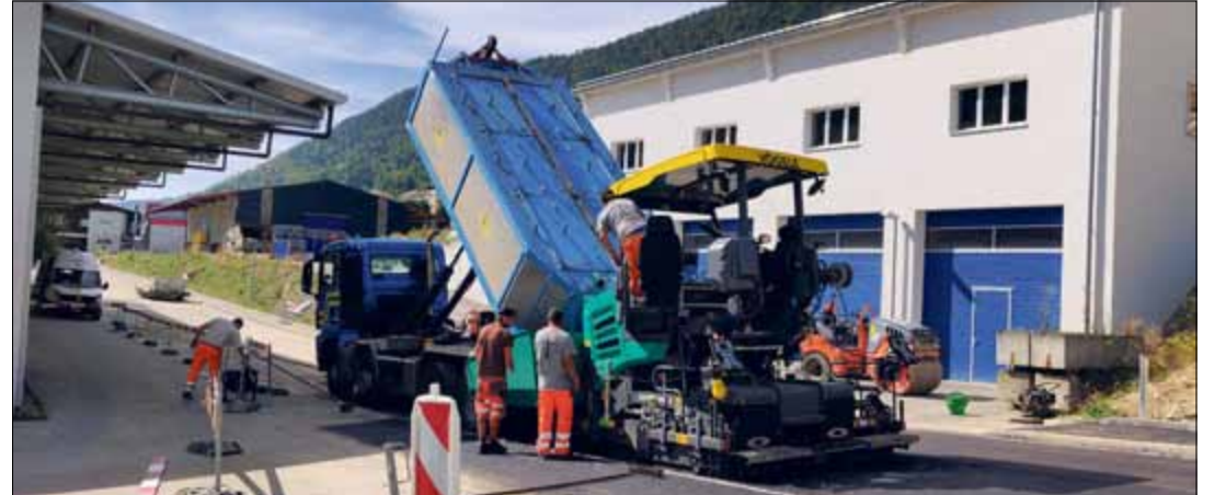
Des travaux complexes liés au gaz ont eu lieu à la rue des Noyes

Le Conseil municipal remercie l'ensemble des intervenants qui ont réalisé ces travaux avec succès ainsi que les riverains et les automobilistes pour leur patience. | cm