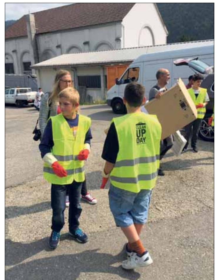
L'an passé, quelque 200 élèves des écoles de Saint-Imier ont participé au Clean-Up Day

Le Clean-Up Day est une opération nationale mise sur pied les 14 et 15 septembre. Son slogan: La Suisse fait place nette. Participe. Il s'agit d'une action de sensibilisation au phénomène du littering et de lutte contre les décharges sauvages. L'objectif est d'agir durablement pour une Suisse propre et ainsi d'apporter «une contribution active à la qualité de vie et au sentiment de sécurité dans sa commune», peut-on lire sur le site officiel. | cm